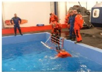
Offshore-HUET-Ausbildung bei Falck Nutec