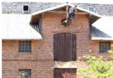
Bauernhof-Giebelkreuz-entfernen (Privatkunde - Doktor)